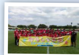
福島ユナイテッドFCなど プロスポーツチームとの交流事業