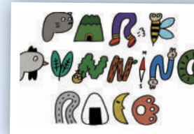
信夫山 パークランニングレース