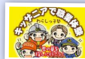
職業体験事業 ～キッザニア訪問～