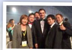
JCI 世界会議 (2015年度 JCI会頭とともに)