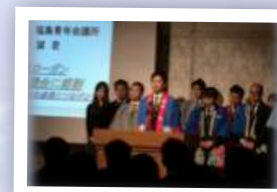
福島ブロック協議会 アカデミー開校式