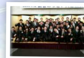
福島ブロック協議会 新春の集い