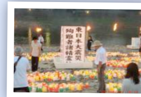
とうろう流し花火大会